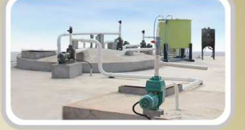
எங்களது தானியங்கி பாக்கிரியா நுண்ணுயிர் வகுக்கி

மேக் பெயர் செம்புக் டேங்க் வாழ்நாள் முழுவதும் பாதுகாப்பானது மற்றும் பராமரிப்பு அற்றது. சாதாரண செம்புக் டேங்க்கில் வெறும் 30% கழிவுகள் மட்டுமே சிதைக்கப்படுகிறது, மீத 70% டேங்க்கினால் தங்கி விடுகிறது. ஆனால் மேக் பெயர் செம்புக் டேங்க்கில் 99.9% கழிவுகள் இனோகுலம் பாக்கிரியா மூலம் செரிக்கப்படுகிறது. இந்த முறையில் கழிவுநீர் மறுசுழற்சி செய்யப்பட்ட நீராக வெளியேறுகிறது. இந்த நீரை செடி கொடுக்கக்கூடிய பயன்படுத்தலாம். இதிலிருந்து வெளியேறும் நீரில் துர்நாற்றம் அறவே இருக்காது.